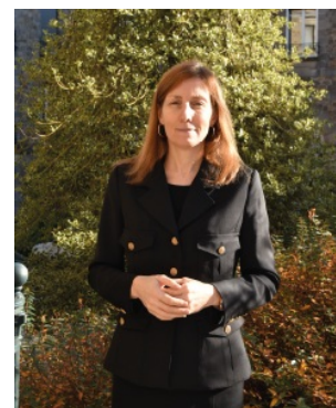
Fabienne BALUSSOU Préfète de la Haute-Vienne

Fabienne BALUSSOU, Préfète de la Haute-Vienne